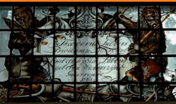
Raam van het kerkje te Noorddijk.

Kennis van de eigen geschiedenis verrijkt